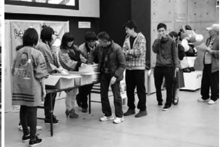
開始10分で抽選会終了となる大盛況！ JA職員も抽選会の対応に大忙しでした！