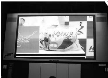
全国ネットでトキノミノルの10/20の新米発売がPRされました！