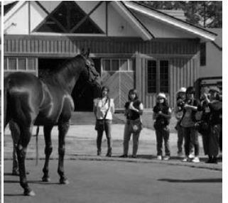
有名種牡馬を間近で見学