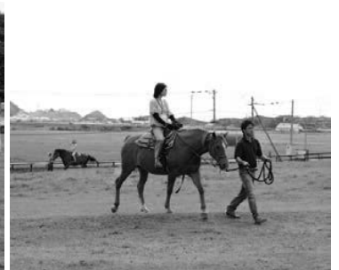
今年も大人気だった乗馬体験(MKランチにて)