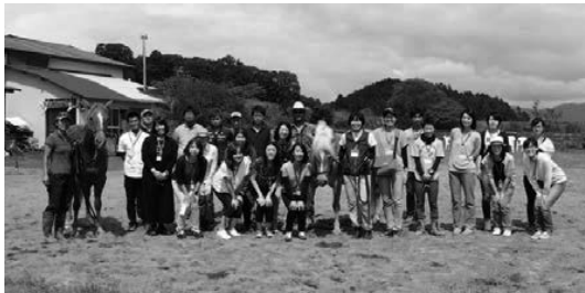
MKランチさんの乗馬と一緒に集合写真