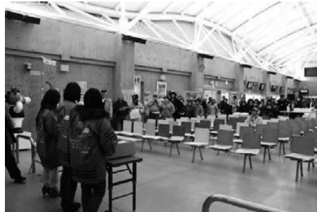
抽選会開始前には既に長蛇の列が！