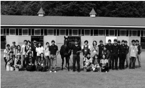
ケイアイファームさんでカナロアのお母さんレディブラッサムと貴重な集合写真