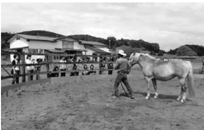
乗馬のほかに、ホースマンシップのデモンストレーションを見学