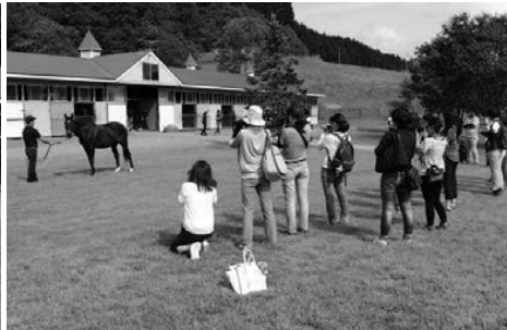
ケイアイファームさんの豪華ラインナップに夢中でシャッターを切る参加者の皆さん