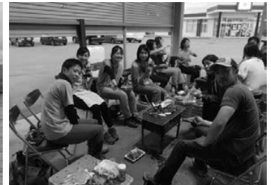
みついし牛のBBQを楽しむ参加者