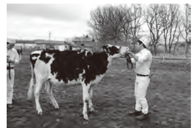
経産の部・最高位 アーノルドチップハニー号