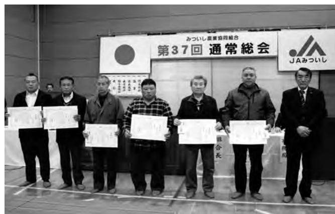
平成30年度 各種共励会総会表彰受賞者の皆さん