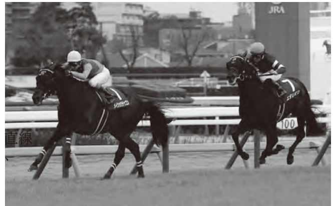
最後の直線で後続馬を突き放し重賞2勝目を飾った武豊騎手とメイショウテツコン号(父マンハッタンカフェ)

次走は平成最後の天皇賞(春)。日経賞の再現となるような、鮮やかに3200mを駆け抜けてくれることを期待しましょう！