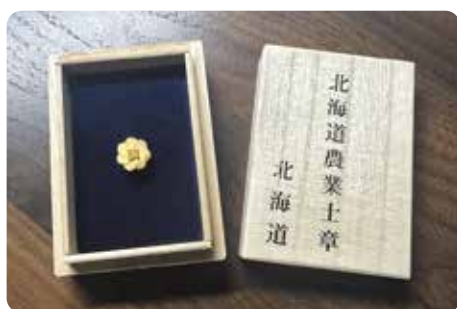
今年2月に認定された農業士

私の祖父、父もアラブ（アングロアラブ）、サラブレッドの生産をしていました。日高では軽種馬をしていた農家が和牛の生産に転換し、馬で培った細やかな飼養技術を牛に適応することで、素牛のレベルは非常に高いとの評判です。巷では米の話題で持ちきりですが、当地区は水田活用から多くが草地となり、それを糧に軽種馬、和牛、酪農が振興しました。